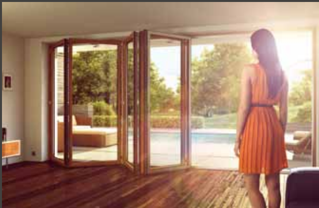
Falt-Schiebe-Systeme Folding Doors Systems