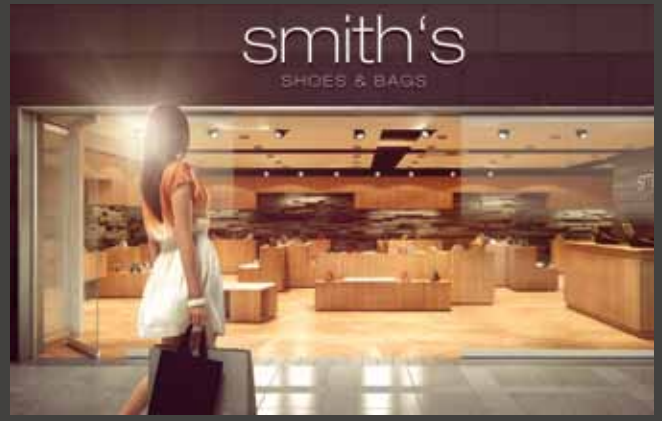
Horizontal-Schiebe-Wand-Systeme Horizontal Sliding Wall Systems