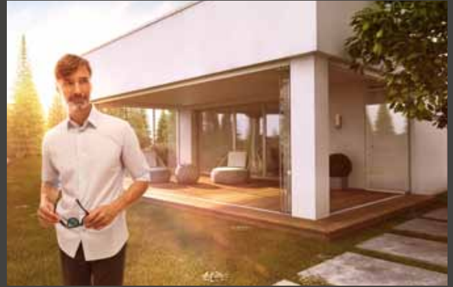
Schiebe-Dreh-Systeme Slide and Turn Systems