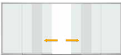
Entriegeln und Schieben des Öffnungsflügels Unlocking and sliding the opening panel