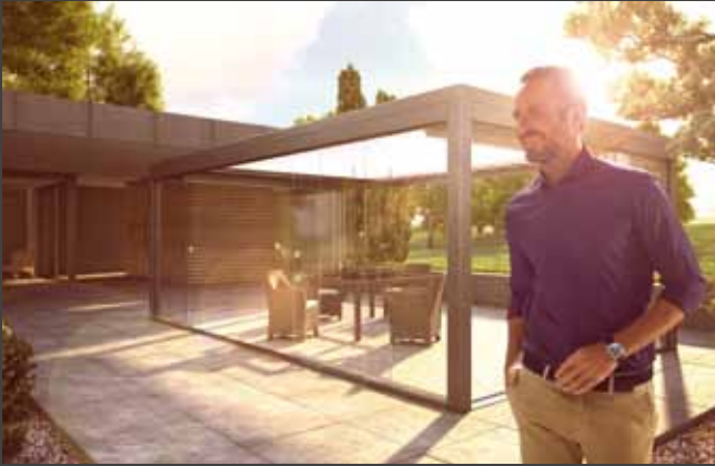
Schiebe-Systeme Sliding Systems