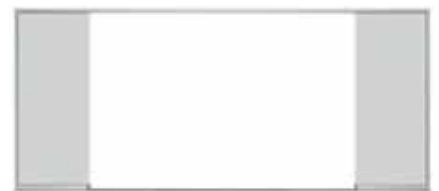
Großer Öffnungsbereich bei geöffneten Elementen Large open area when elements are opened